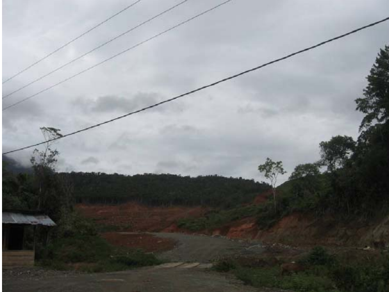
Gambar 3. Penebangan hutan untuk pembangunan. 7

Padahal sebenarnya pendapatan dari hutan lebih besar jika dikaitkan dengan kekayaan plasma nutfah yang terkandung di dalamnya. Nampaknya hal ini juga menjadi perhatian dari DPR Papua (DPRP) dan Majelis Rakyat Papua (MRP) sehingga mereka baru-baru mengeluarkan Peraturan Daerah Khusus (Perdasus) tentang Kehutanan dan tentang Hak Kekayaan Intelektual dan Ekonomi Rakyat.