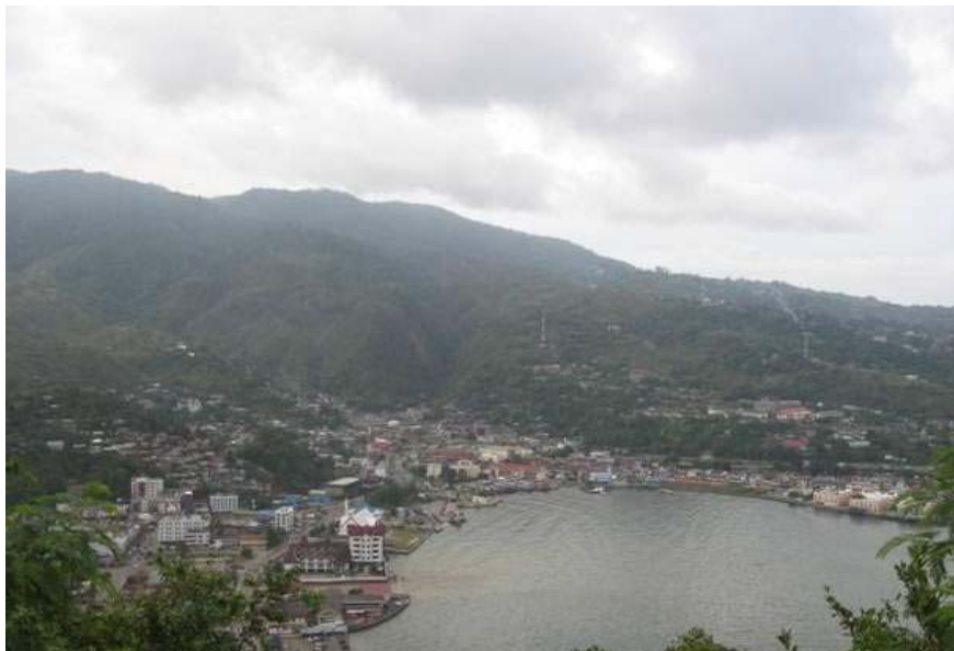
Gambar 5. Kota Jayapura dan teluk Humboldt dilihat dari ketinggian. 11

Dalam pemahaman pimpinan MRP, meskipun lembaga ini tidak mempunyai fungsi legislasi tetapi memiliki fungsi konsultasi terhadap legislasi dan fungsi kontrol budaya terhadap muatan pengambilan keputusan agar sesuai dengan aspirasi orang asli Papua dan melestarikan kebudayaan Papua. (Wawancara dengan Frans Woskpakrik, 2009).