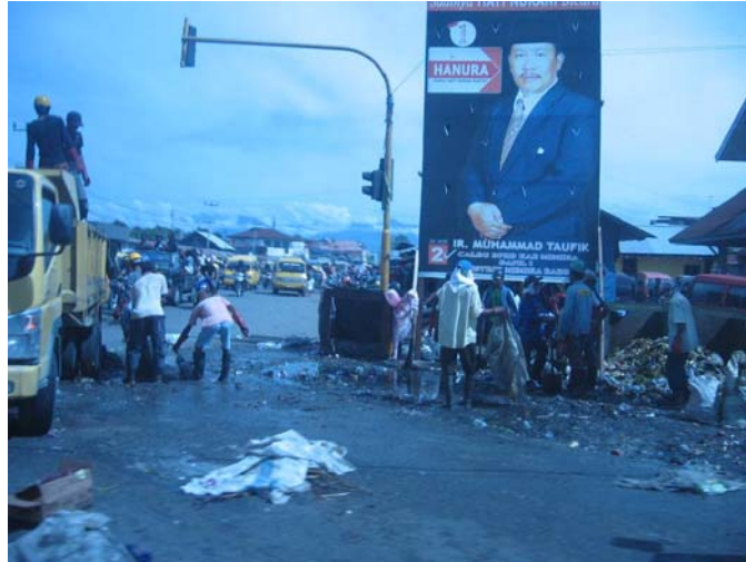
Gambar 4. Masalah sampah di sebuah sudut kota Timika 8

Pengelolaan sampah yang lemah akan menurunkan kualitas hidup masyarakat, khususnya masyarakat miskin di perkotaan yang biasanya tidak bisa mengakses fasilitas yang higienis. Penurunan kualitas hidup masyarakat akan menurunkan produktifitas masyarakat.