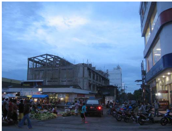
Gambar 6. Pasar Imbi (pedagang beralas tanah di sebelah kiri) dan Supermarket Gelael (gedung sebelah kanan) di Jayapura.

Akibat dari lemahnya penguasaan sumber-sumber ekonomi, maka dirasakan ketimpangan penikmat manfaat ekonomi. Kondisi ini sudah mencapai tingkat dimana ada perasaan menjadi penonton, atau timbul demonstration effect , karena berbagai kemajuan dinikmati oleh satu kelompok masyarakat sedangkan kelompok masyarakat lainnya hanya bisa menonton. Seorang tokoh setempat bertanya secara retorik kepada penulis, "Berapa banyak orang asli Papua yang berbelanja di Gelael? Berapa banyak yang hanya menonton? Mengapa pedagang di Pasar Imbi berjualan beralaskan tanah di tengah terik panas dan hujan tanpa pernah diberdayakan atau diperkuat oleh pemerintah?" (Lihat Gambar 6).