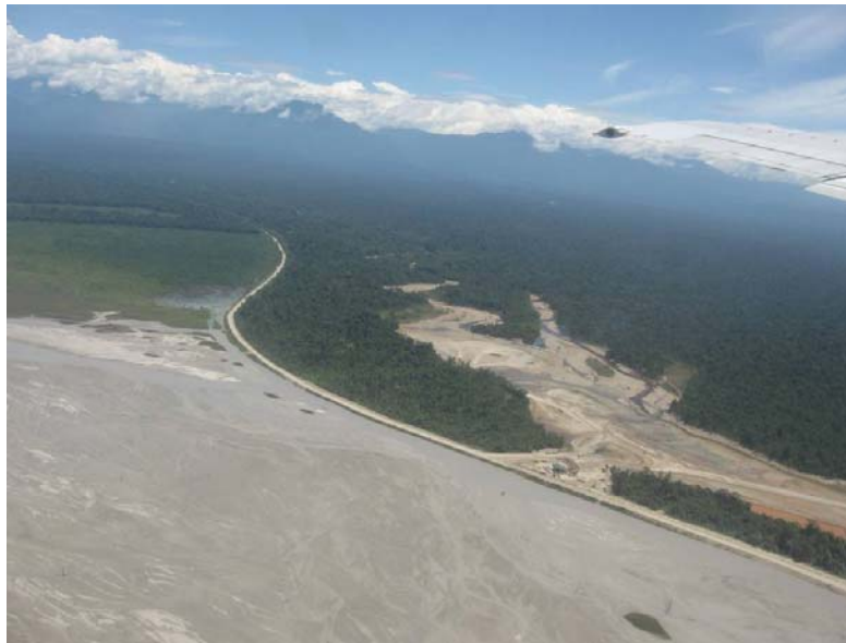
Gambar 2. Penyaluran tailing PT Freeport dilihat dari udara. 6

Pengelolaan limbah terkait dengan pembuangan limbah yang dihasilkan oleh aktifitas pertambangan di gunung yang kemudian dialirkan melalui aliran sungai sehingga merusak ekosistem sungai dan bahkan mematikan mata pencaharian penduduk (lihat Gambar 2). Salah satu masalah utama adalah dalam pembuangan tailing dari pertambangan PT Freeport di Timika, sehingga menyebabkan beberapa kampung harus dipindahkan atau direlokasi ke tempat lain. Pihak perusahaan kemudian mengadakan program-program untuk memulihkan mata pencaharian kampung yang dipindahkan.